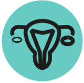
AIKAINEN MENOPAUSI eli vaihdevuodet

Naisen lisääntymisterveyden ongelmat liittyvät usein hormonitasapainon muutoksiin. Hormonaaliset haitta-aineet voivat vaikuttaa lisääntymisterveyteen samalla tavalla kuin tunnetut riskitekijät kuten esimerkiksi tupakointi ja ylipaino. Hormonaaliset haitta-aineet voivat häiritä hormonitasapainoa läpi elämän sikiökehityksestä aikuisuuteen, vaikuttaen useiden terveysongelmien syntyyn.