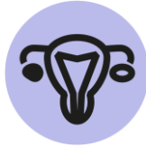
ENDOMETRIOOSI eli kohdun limakalvon pesäkesirottumatauti