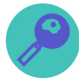
ERÄÄT FLUORATUT YHDISTEET KUTEN PFOS JA PFOA