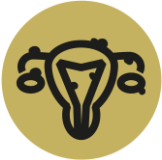
PCOS eli munasarjojen monirakkulaoireyhyelmä