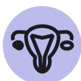
SÍNDROME D'OVARI POLIQUÍSTIC