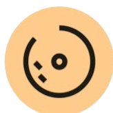
CÀNCER DE PIT