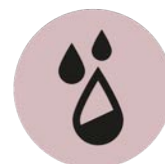
CICLES MENSTRUALS IRREGULARS