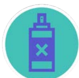
ALGUNS PESTICIDES I BIOCIDES