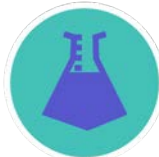
ALGUNS FTALATS COM EL DEHP