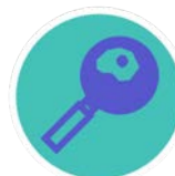
ALGUNS PRODUTOS QUÍMICOS PERFLUORADOS COMO PFOA E PFOS