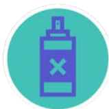
ALGUNS PESTICIDAS E BIOCIDAS