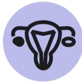
POLYCYSTISK OVARIE SYNDROM (PCOS)