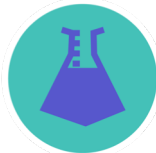
SOMMIGE WEEKMAKERS, ZOALS DEHP