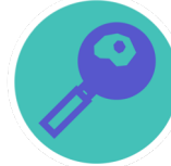
SOMMIGE GEFLUOREERDE CHEMICALIËN (PFAS) ZOALS PFOS EN PFOA