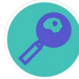
COMPOSTI PERFLUORINATI COME IE PFOS E IL PFOA